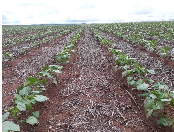
Fig. 2ª Algodão com uma boa germinação 24 DAE.