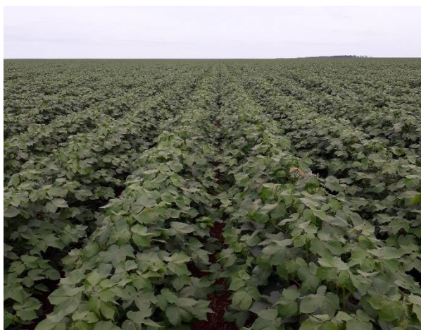
Fig. 1. Algodão safra com 70 dias de emergido.

Em ambas as regiões, nas áreas onde foram semeadas com a fibrosa na safra 16/17, estão com sérios problemas de plantas tigueras de algodão, na soja e no milho; nestas plantas foram encontradas presenças de bicudo com ataques de alimentações e posturas nos botões florais. Após a colheita da soja e do milho, a praga migrará para as áreas de algodão estando apta em realizar posturas e alimentações, causando prejuízo para a cultura. É importante que as fazendas redobrem a atenção no monitoramento da praga e façam as aplicações de borda duas vezes por semana para impedir o estabelecimento da praga na área. Lembrando que o sucesso de uma safra que se inicia, depende das ações tomadas pela propriedade no final da safra anterior. Ações de controle malfeitas no final da safra e entressafra comprometerão os resultados da safra posterior.