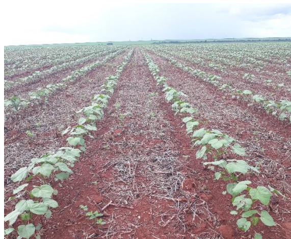
Fig. 2. Algodão 2ª safra da região de Mineiros aos 31 DAE.

Fonte das informações: Projeto Bicudo de Goiás – Fialgo.