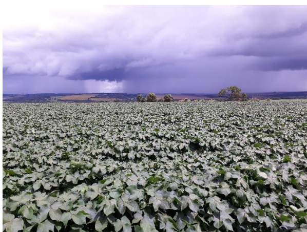
Fig. 1ª algodão com um bom vigor 59 DAE.