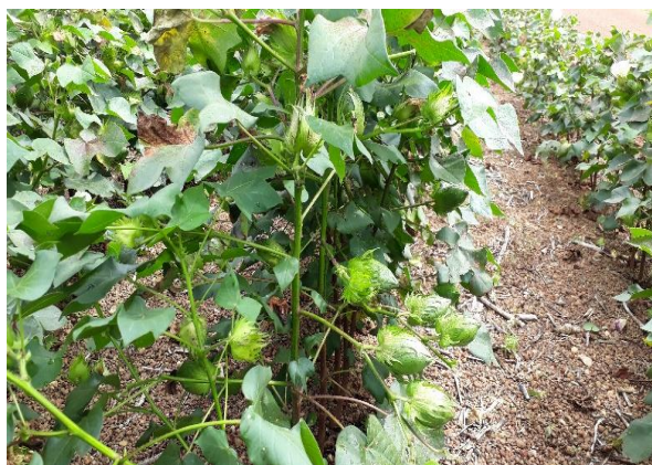
Fig. 1 – Região Luziânia, 1ª área plantada