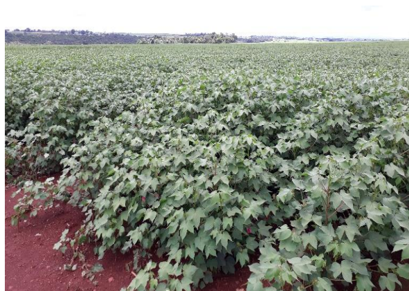
Fig. 2 – Região Goiatuba, 1ª área plantada